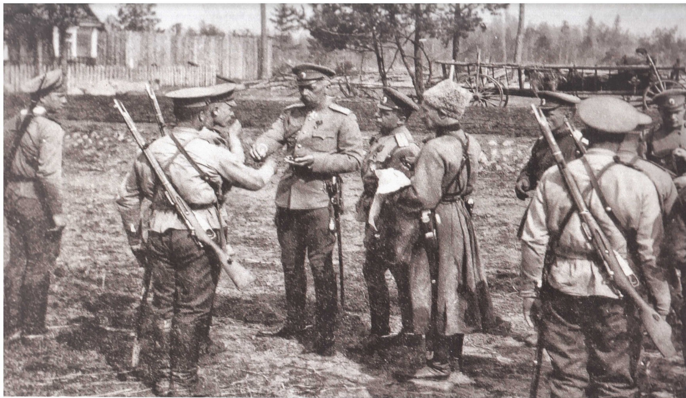
Награждение русских солдат георгиевскими крестами великим князем Георгием Михайловичем у ст. Косово. 23 августа 1915 года.

Наш новый https://www.facebook.com/clcr.gazette