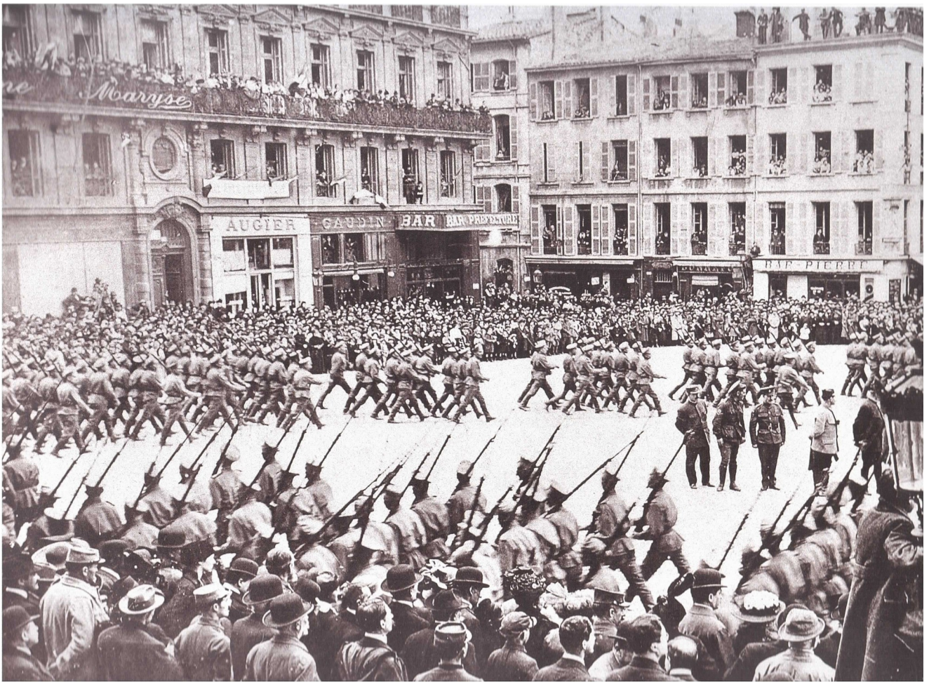
Русские войска во Франции.

Прохождение церемониальным маршем по площади перед Марсельской префектурой. Апрель 1916